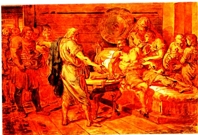
Когда Минин пришел к Пожарскому, князь оправлялся от ран, полученных в боях с поляками

хваткой, предприимчивостью, рассудительностью и справедливостью. Чем заслужил уважение среди посадского торгово-ремесленного люда Нижнего Новгорода, избравшего его в сентябре 1611 года земским старостой.