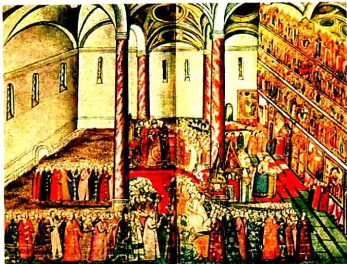
Коронация Михаила Федоровича Романова стала возможна только благодаря Второму ополчению

сложной. С самого начала у Минина и Пожарского не сложились отношения с князем Дмитрием Трубецким, предводителем казачьих отрядов Первого земского ополчения, возникшего еще весной 1611 года. Не испытывая к нему доверия, руководители Второго ополчения сразу же после прихода в Москву отказались расположиться лагерем в его деревянном остроге у Яузских ворот, а окопались у Арбатских ворот.