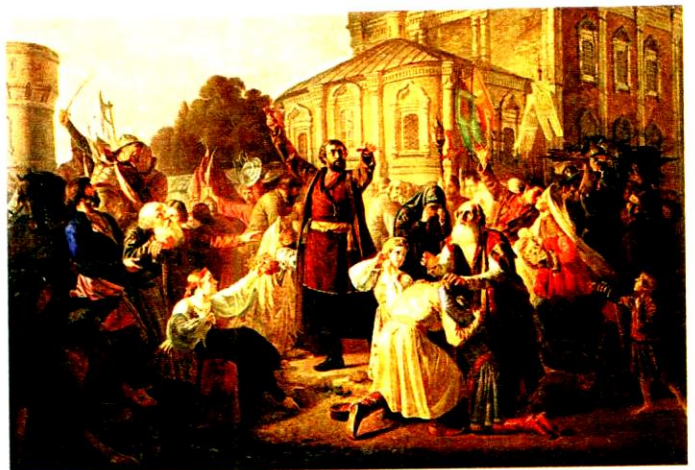
«Воззвание Минина к нижегородцам в 1611 году». Картина Михаила Пескова, 1861 год

Оплата нанятых на службу людей, закупки вооружения и прочих припасов для войска требовали значительных средств. Заведую казной Второго ополчения, Минин проявил себя как рачительный хозяйственник, сумевший