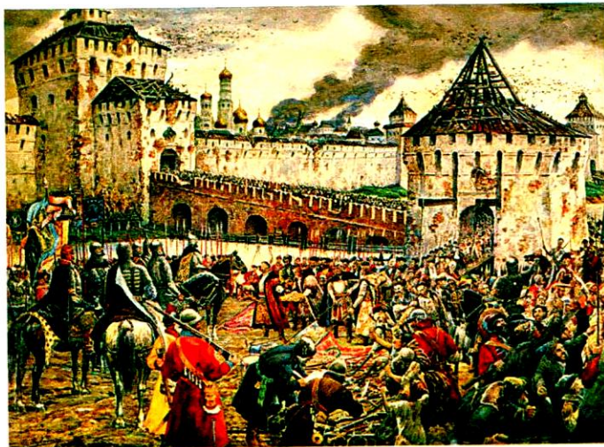
Изгнание поляков из Кремля стало переломным моментом, хотя до окончания Смутного времени было еще далеко

Ситуация в районе Москвы к концу лета была достаточно